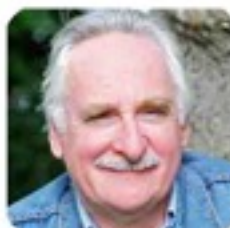
Jack Lynch (IRLANDA)